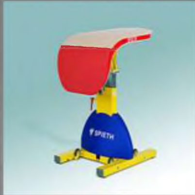
снаряд для опорного прыжка