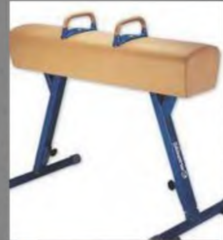
конь с ручками