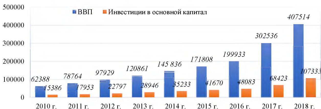
Рисунок 1. Динамика ВВП и инвестиций в основной капитал (млрд сум)