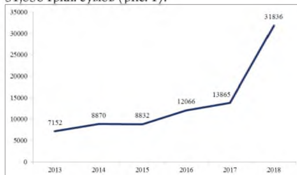
Рис. 1. Динамика объема сделок на УзРСТБ за период 2013-2018 годов, млрд сумов. [6].

АО «Узбекская республиканская товарно-сырьевая биржа» (УзРСТБ), созданная в 1994 году, является одной из наиболее крупных бирж республики. За последние 5 лет объемы сделок на УзРСТБ выросли более чем в 3,5 раза и достигли значения 31,836 трлн. сумов (рис. 1).